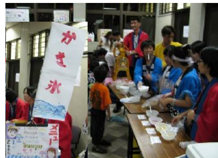
子供たちが出店したかき氷屋。メニューやノボリも作り、お店やさんを楽しんだ。

私は9月から日本人学校（土曜日だけ開かれる補習校）で中学生に数学を教えているので、学校の行事として参加した。小学校高学年と中学生が出店したかき氷屋は、子供たちが熱心に呼び込みをやり繁盛したが、氷を削るのは大人でないと無理で、校長他の男性陣が奮闘した。外地に暮らす子供たちにとって、皆で何かをやり遂げたこと、日本文化に触れたことが、きっと良い思い出になったことと思う。