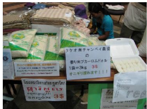
協力隊員の共同出店。手前はタケオ州の農協のコメの産直販売、奥はカンボット州の職業訓練校の学生が織った木綿のクロマー（カンボジア式スカート）。

カンボジアでは現在90%以上の子供が小学校に入学できるようになったが、中学は60%、高校は23%とまだまだ初等中等教育の拡充が必要である。また6月末に全国一斉の高校卒業試験があったが、政府の発表では約9万人が受験しており、これは対象年齢層の24%に当たり、上の数値とほぼ合っている。