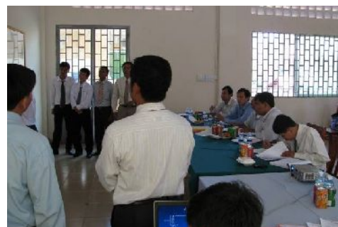
夜間部学生の卒業研究グループ発表の様子。 右に座っているのは審査する先生方。

9月下旬に私の学校で卒業試験があり、昼間部 103 人、 夜間部 146 人の大学生が受験した。平均年齢は昼間部 23.9 才、夜間部 28.5 才と年齢差がある。昼間部はすべ て 20 代だが、夜間部では 30 才以上が 44 人(30.1%)おり、 30 代、40 代の方は若い時に教育機会に恵まれなかった のだと思う。カンボジアの社会では大卒の資格がより高 い地位を得るために必要ということはあるが、4 年半(学 位を貰うまで 5 年間)夜学に通い続けた努力には頭が下 がる。卒業発表を聞いて、カンボジア人は努力家が多い という印象を受けた。