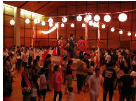
盆踊り大会の様子。舞台の上は日本的だが、下では皆カンボジア式に踊っている。

カンボジア日本人会主催の盆踊り大会が10月18日、カンボジア日本人材開発センターで開かれた。当日はあいにくの雨模様の中、当地に滞在している日本人、外国人、多くのカンボジア人が集まり、踊りや屋台で日本文化を楽しんだ。会場を覗いてみると、盆踊りの飾りつけは日本風だが、流れてくる曲はポピュラー音楽ばかりで、腰の前で手を左右にひらひらさせるカンボジア式の踊りを皆踊っていた。ディスコのような青いスポットライトの照明もあり日本の盆踊りとはイメージが違ったが、皆楽しく踊っていて「これがカンボジアの盆踊りなんだ」と妙に納得した。