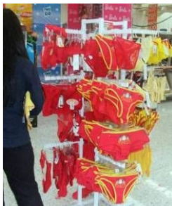
この女性は、愛よりも金を選択した?

メキシコでは新しい年を迎えるにあたって、大晦日には新品の衣類を身につけ、他の人からプレゼントされた赤い下着(愛に恵まれるように)、または黄色い下着(お金をもたらしように)を身につけるという話を聞いたことがある。愛も金も欲しい人は重ね着をしたりするのだろうか? 私は新品の下着はともかくとして、どんなご利益があろうとも、そんなものは着ようとは思わない。