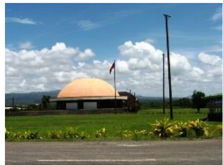
サモアの国会議事堂（伝統建築）

私はJICAサモア事務所には定期的に電話報告をしたがミステリーの話はしなかった。冒険小説「宝島」の生まれた島で体験した私の小さい「真夏の夜の夢」としてとっておこう